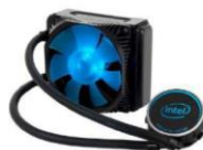
hladnjak na vodeno hlađenje

Primjer dobrog slajda na kojemu nema ni premalo ni previše teksta te ima prostora da se umetne prigodna slika uz tekst.